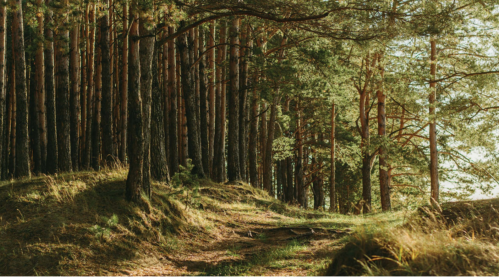
Langt hovedparten af de danske skove er skabt af mennesker.