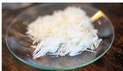
Forskernes krystaller før de udsættes for CO 2 og derved svulmer op.