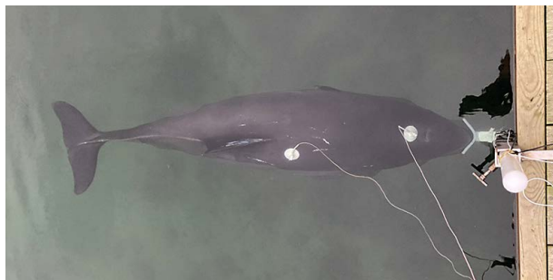
Marsvinet Freja er trænet til at stå stille i vandet, mens hun får testet sin hørelse.

Et nyt studie fra Institut for Biologi ved Aarhus Universitet, offentliggjort i The Journal of the Acoustical Society of America giver nu ny indsigt i, hvordan marsvins høresystem reagerer, når deres lydverden forstyrres. Til forskernes overraskelse viser studiet, at mar-