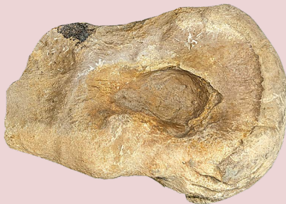
Den delvise fodknogle. Den trekantede fordybning midt på knoglen er selve bidmærket.

Illustration: D. Barrea-Guevara. Redigeret af Denver Fowler.