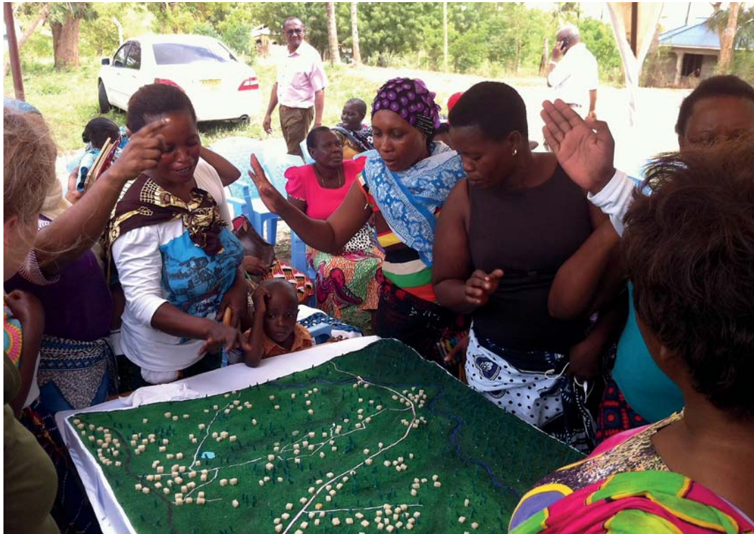
Workshop med borgere i bydelen Kibululu i Dar es Salaam, Tanzania, om udviklingen af lokalt forankrede naturbaserede regnvandsløsninger, der giver mening for de involverede parter og adresserer mange forskellige problemstillinger på samme tid.

der endnu ikke er bygget – så vi har en unik mulighed for at gentænke byen og naturens rolle i byen, inden vi plastrer det hele til med asfalt og beton. Men det haster. Der flytter mere end 200.000 mennesker ind til byerne hver dag. Vi har en mulighed for at tænke helhedsorienteret fra starten og indtænke landskabets multifunktionelle rolle fra starten – frem for at det er noget, der som i eksemplet Bryggervangen i København bliver tilpasset 100 år efter, byen er bygget.