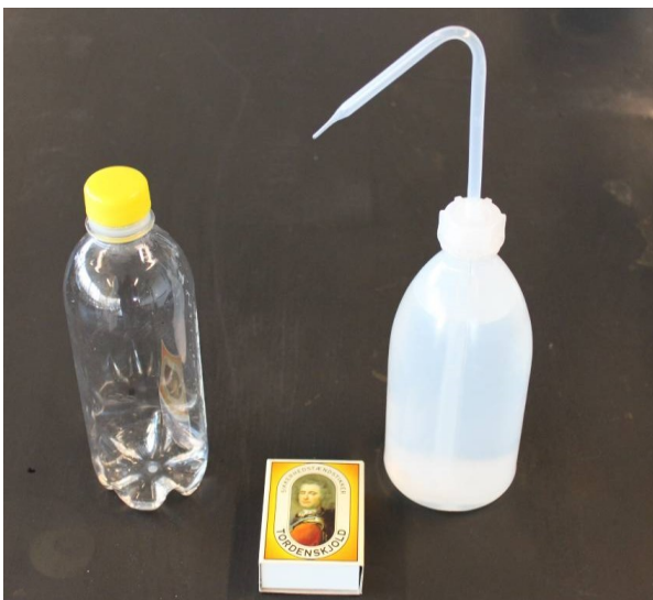
Udstyr til selv at lave skyer i en flaske.