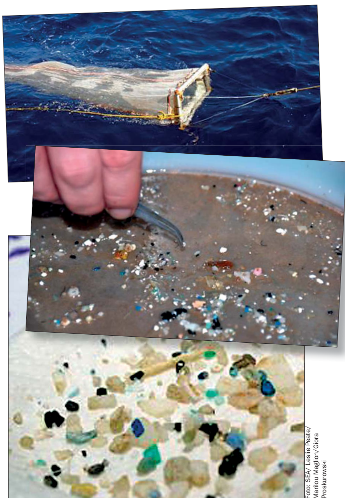
Små plastikstumper som disse er systematisk blevet indsamlet fra havet i mere end 20 år.

Overraskende nok har det vist sig, at mængden af pla-