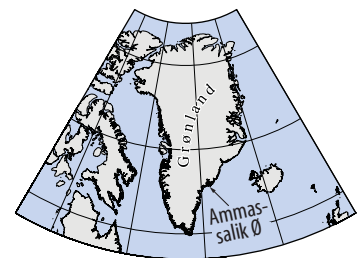
Mittivakkat-gletscheren findes på Ammassalik Ø i Østgrønland.

Observationer fra dette års felt sæson i Grønland viser, at den rekordvarme sommer har betydet en meget omfattende gletscherafsmeltning, hvor gletscherfronterne nu trækker sig tilbage i et hidtil uset tempo.