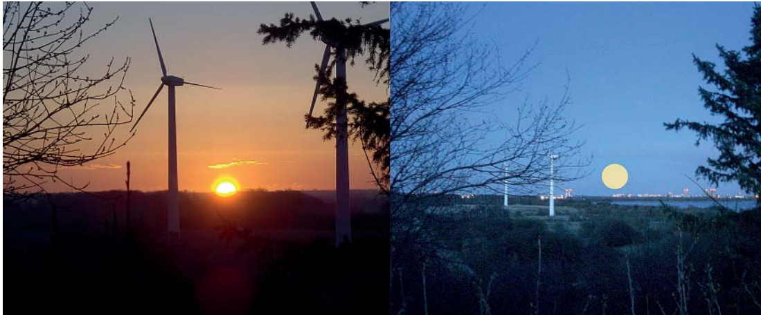
Billedet viser crossover forår 2015 den 4. april. Venstre billede viser solopgangen i retningen 80 grader og højre billede viser forårsfuldmåneopgangen i retningen 101 grader ved solnedgang. Begge billeder er taget fra en bakke i Kystagerparken i Hvidovre. Læg mærke til positionen af de to vindmøller, som er brugt som pejlepunkter. Det var svært at se selve måneopgangen denne dag pga. skyer, så jeg har markeret månens position.