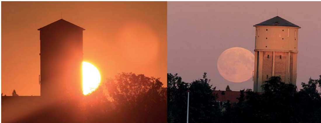
Billedet viser crossover efterår 2015 den 27. september, hvor solopgang og fuldmåneopgang er modsat foråret. Venstre billede viser solopgangen i retningen 91,8 grader og højre billede viser fuldmåneopgangen i retningen 91,4 grader ved solnedgang. Dagen før stod månen op i retningen 100 grader. Den meget lille vinkelforskel gør, at man først ville opdage crossover dagen efter, hvis man ikke har et meget præcist pejlemærke. Begge billeder er taget fra en position i Ørestaden og pejlemærket er et Vandtårn i Tårnby på Amager. Den efterfølgende måneformørkelse den 28. september om aftenen var synlig og tydelig fra en skyfri himmel.

gjøs sammenhæng. Det var mere vigtigt at finde en beregningsmetode, der kunne fastlægge påsken og dermed beholde det tidspunkt eller de tidspunkter, hvor man tidligere holdt et forårsritual.